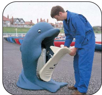
1. Abrir la panza levantando los pestillos escondidos dentro de las aletas, y separarla del cuerpo del delfín.

A Splash se le ha diseñado especialmente una puerta con cierre de pestillo que, sin necesidad de llave, facilita el acceso al operario.