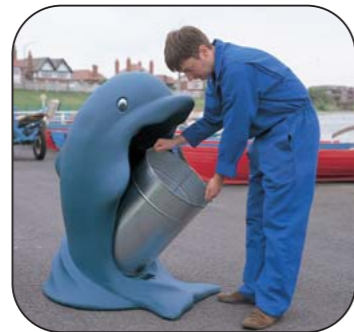
2. Retirar la panza completamente. Sacar el cubo interior usando las dos asas a ambos lados del mismo.