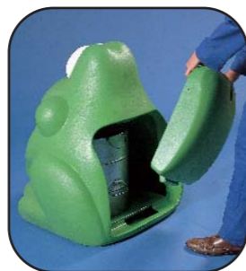
3. Introducir la lengüeta de la puerta en la base, empujar hacia el cuerpo y cerrar con la llave especial.