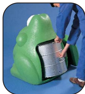
2. Utilizar las asas para manipular el cubo interior galvanizado.