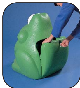
1. Con la llave especial, abrir y retirar la puerta, sujetándola por el espacio disponible para las manos.

El acceso a su interior se consigue abriendo la puerta trasera con una llave especialmente diseñada para evitar actos vandálicos o el acceso no autorizado. La base de la papelera está diseñada para colocar el cubo interior de manera correcta y estable.