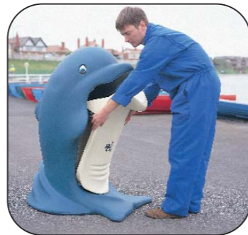
3. Después de su vaciado, reponer el cubo dentro del cuerpo y colocar la panza en su posición original, cerciorándose de que los pestillos de cierre queden encajados.